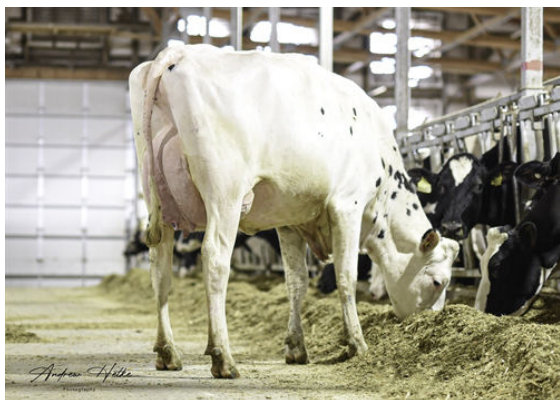
SDDOTTE BEEGEEES 4949